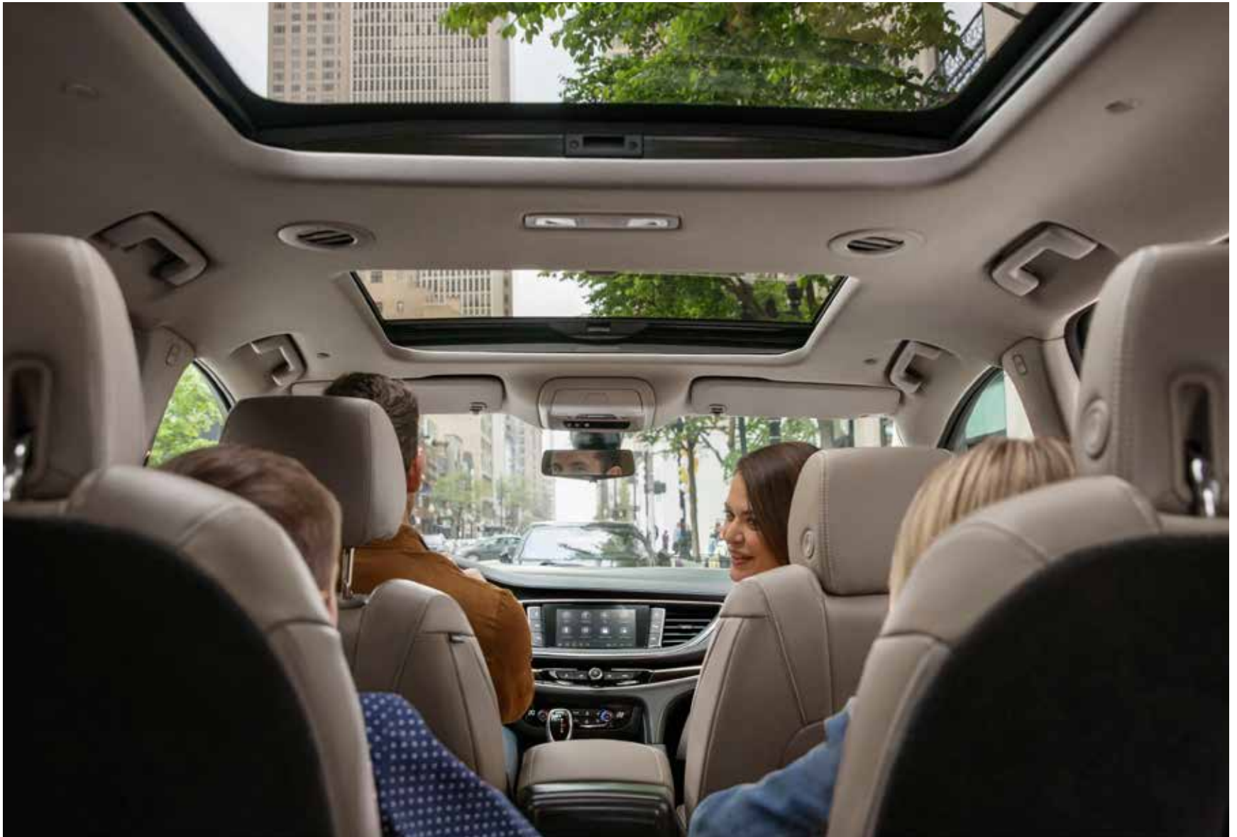
Intérieur de l'Enclave groupe haut de gamme illustré en argile avec garnitures contrastantes ébène et équipement en option.