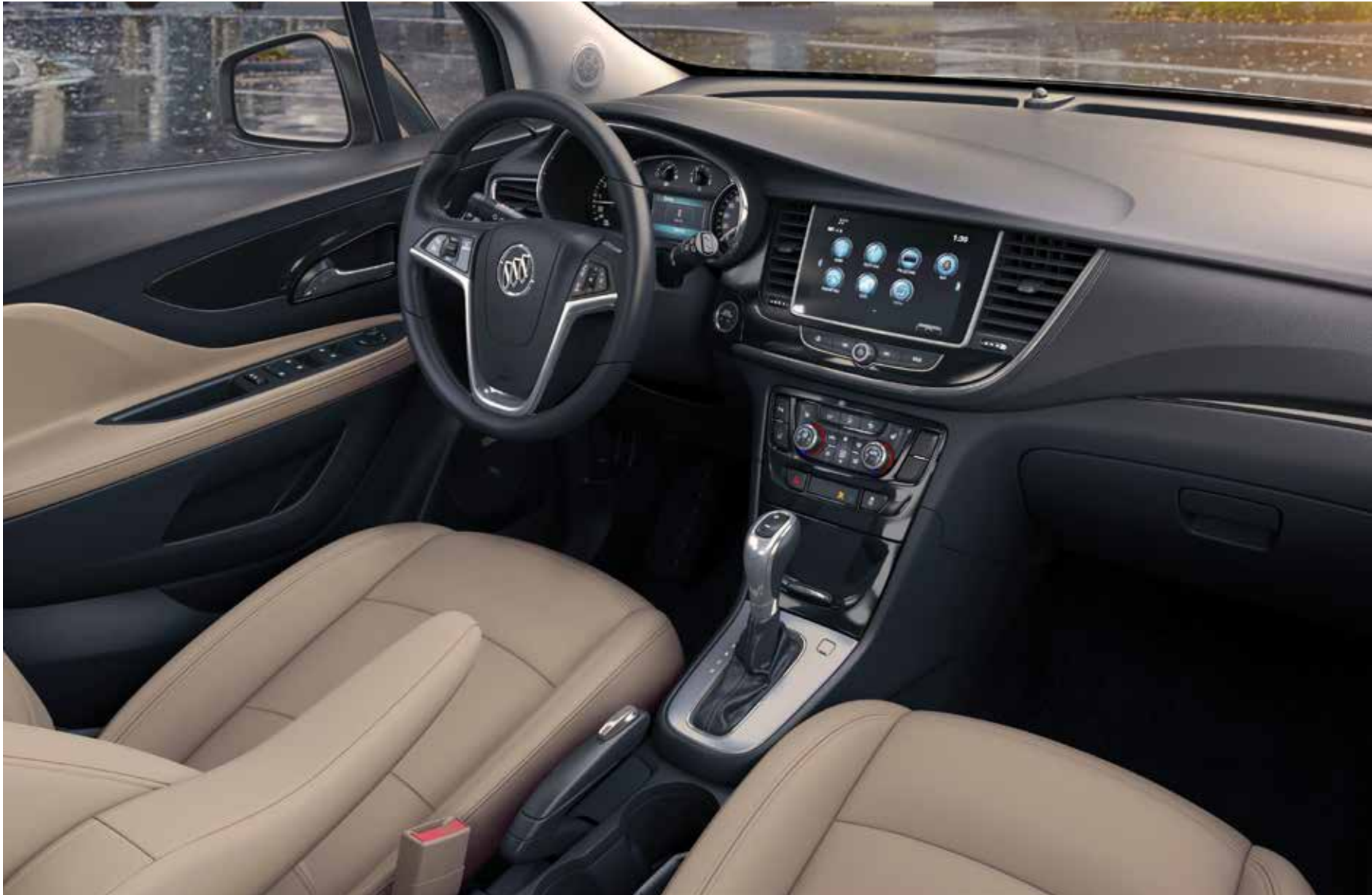
Intérieur de l'Encore groupe caractère illustré en argile avec équipement en option.