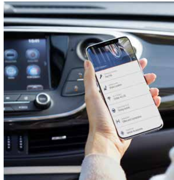
Modèle américain présenté. Les caractéristiques illustrées peuvent ne pas être disponibles au Canada.

RECHARGE SANS FIL POUR TÉLÉPHONES INTELLIGENTS 6 Libérez-vous des fils grâce au dispositif de recharge sans fil pour téléphones intelligents compatibles, en option sur les modèles Buick sélectionnés.