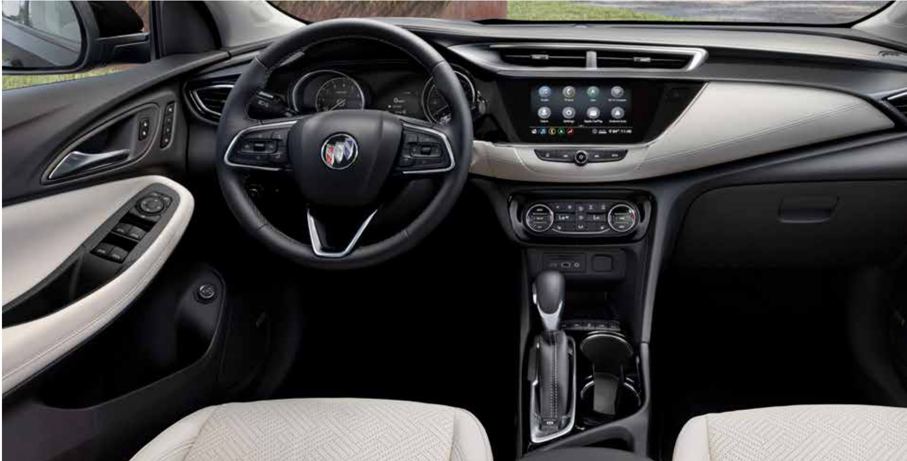
Modèle américain présenté. Intérieur de l'Encore GX groupe caractère illustré en beige murmure avec garnitures contrastantes ébène et équipement en option.