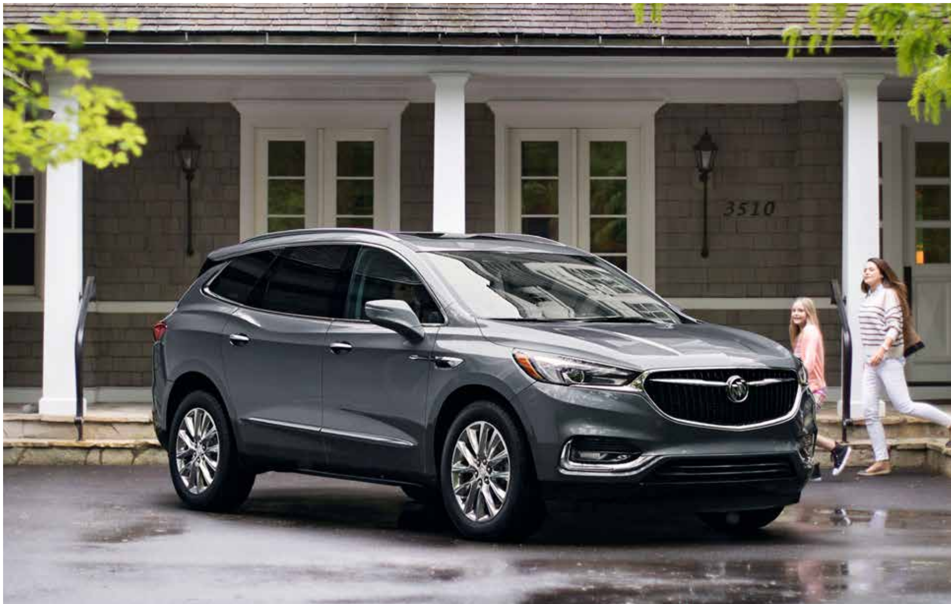
Enclave groupe haut de gamme illustré en acier satiné métallisé (peinture haut de gamme moyennant supplément) avec équipement en option.