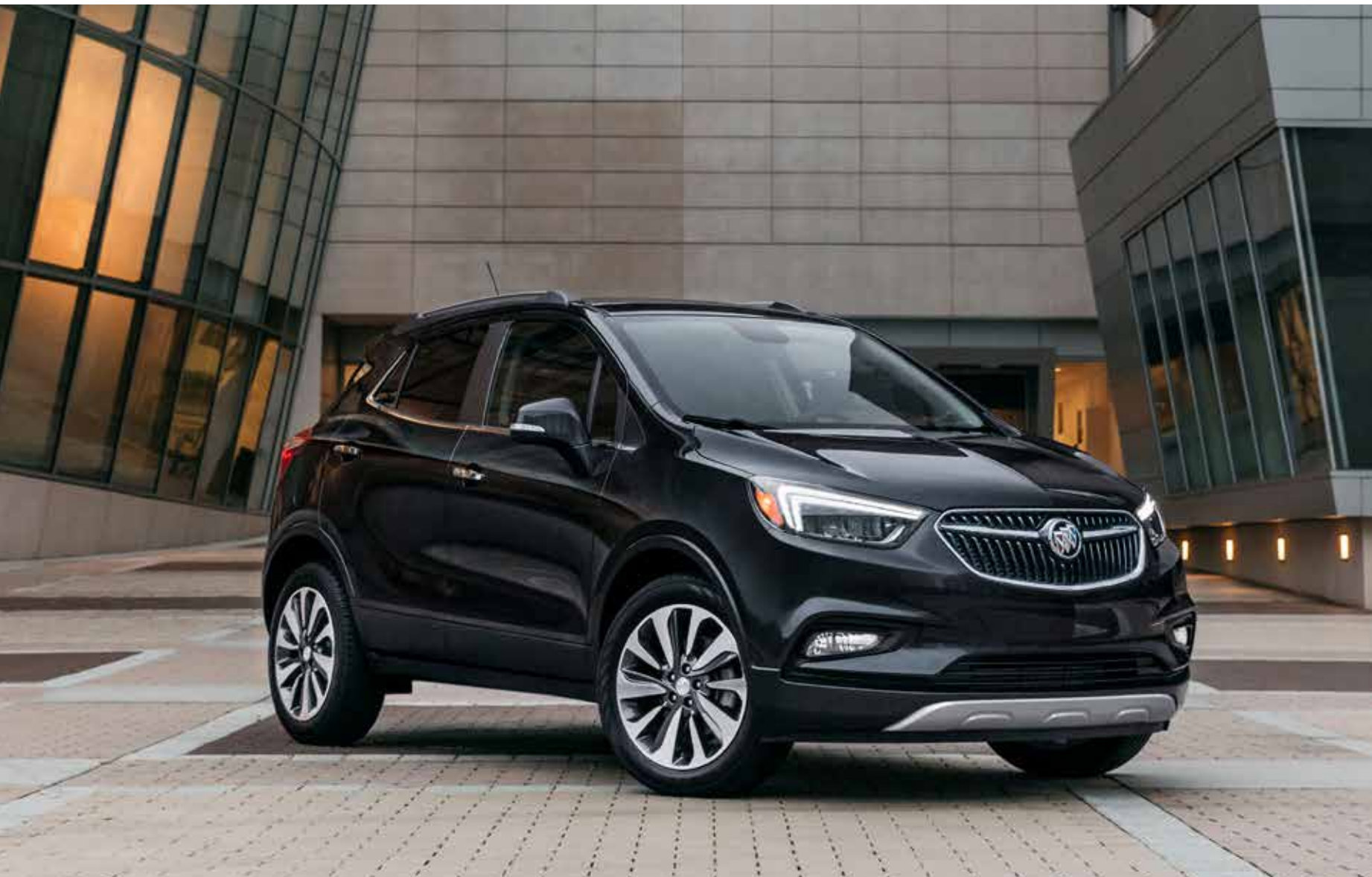
Encore groupe caractère illustré en ébène crépuscule métallisé (peinture haut de gamme moyennant supplément) avec équipement en option.