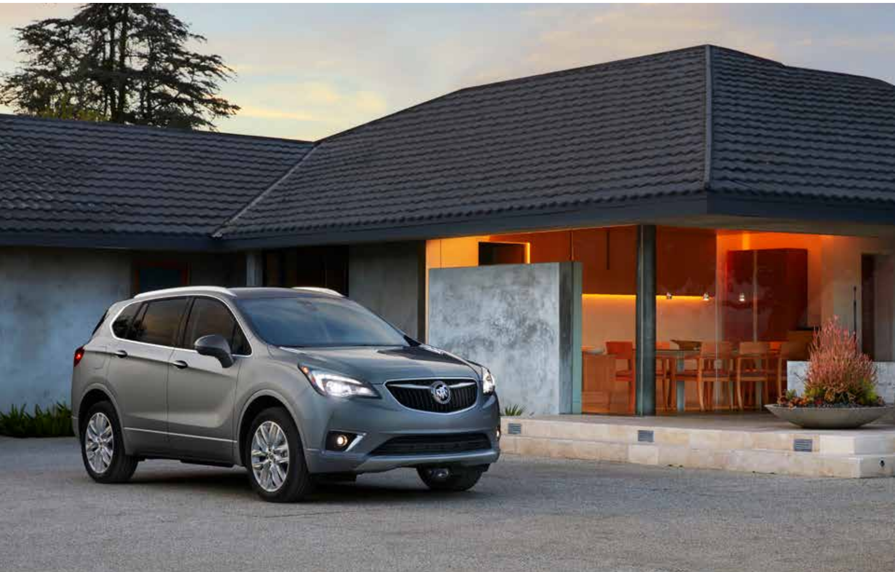
Envision groupe haut de gamme II illustré en acier satiné métallisé (peinture haut de gamme moyennant supplément) avec équipement en option.