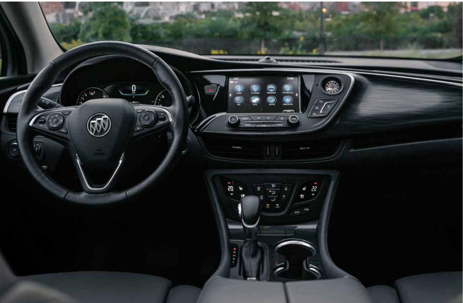
Intérieur de l'Envision groupe haut de gamme II illustré en gris galvanisé foncé avec garnitures contrastantes ébène et équipement en option.