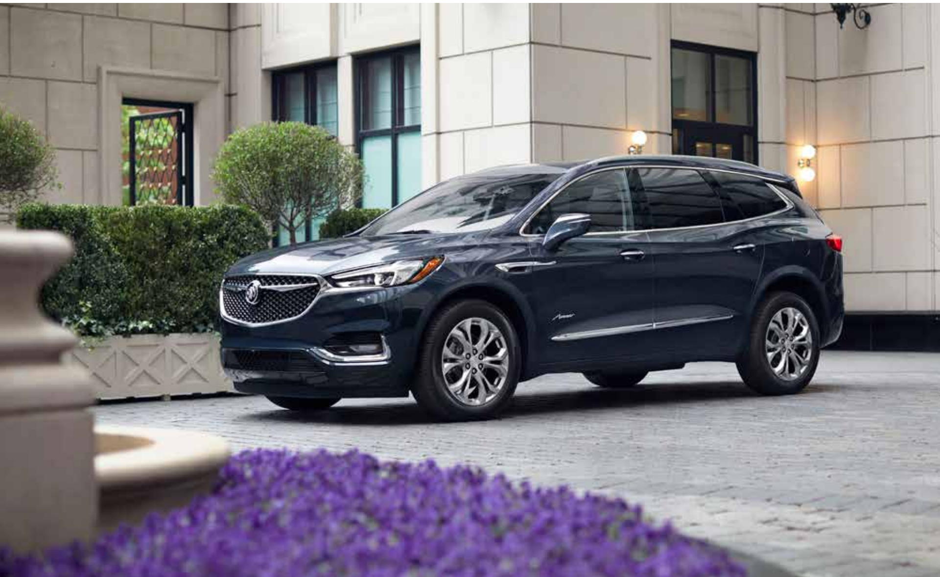
Enclave Avenir illustré en ardoise foncé métallisé avec équipement en option.