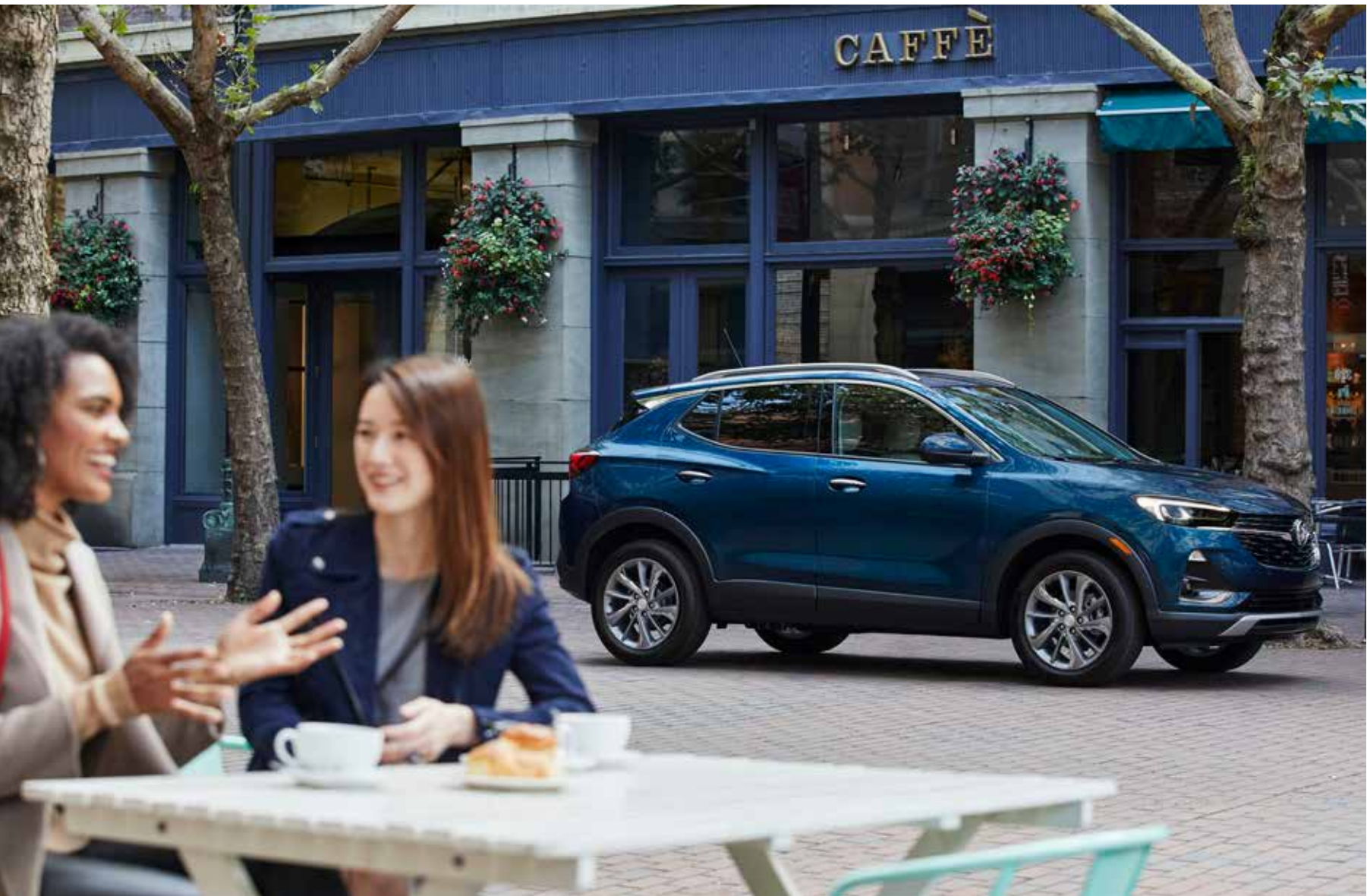
Encore GX groupe caractère illustré en azur foncé métallisé (peinture haut de gamme moyennant supplément) avec groupe expérience Buick et équipement en option.